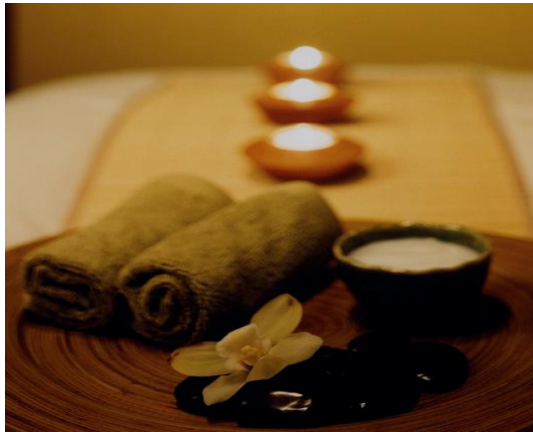
Productos naturales, que estimulan la energía, vitalizan el cuerpo y oxigenan la piel.

Sus diferentes programas están pensados para eliminar energías negativas tensiones acumuladas, recuperar el tono vital, activar la piel y tomar conciencia de un nuevo Bienestar interior.